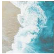
Photoシリーズ / 108