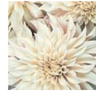
Flowerシリーズ / 114