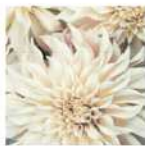
Flowersシリーズ / 114