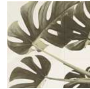
Flowerシリーズ / 113