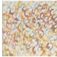
Art Brutシリーズ / 56