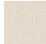
Simpleシリーズ / SLA2N