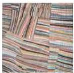
Art Brutsシリーズ / 50