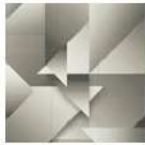
Art & Patternシリーズ / 13