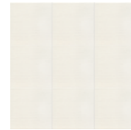
Simpleシリーズ / SLA1N