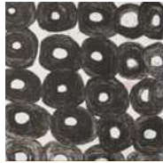
Art Brutシリーズ / 55