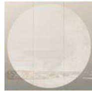
Art & Patternシリーズ / 11