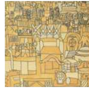
Art Brutシリーズ / 57