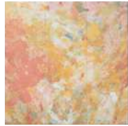
Art Brutシリーズ / 54