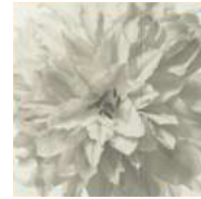
Flowerシリーズ / 14