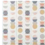
Art & Patternシリーズ / 03