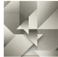
Art & Patternシリーズ / 13